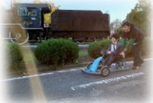
交通公園(萩原公園)