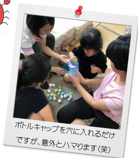
ボトルキャップを穴に入れるだけ ですが、意外とハマります(笑)