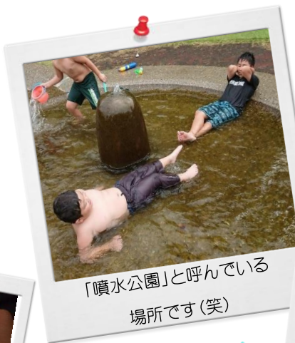
「噴水公園」と呼んでいる 場所です(笑)