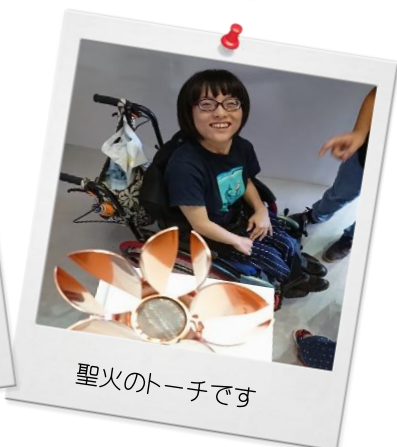
聖火のトーチです