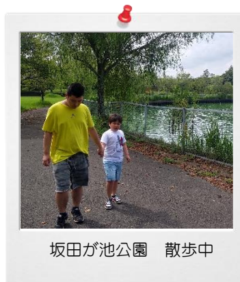
坂田が池公園 散歩中