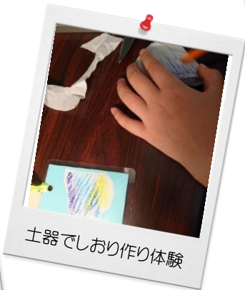
土器でしおり作り体験