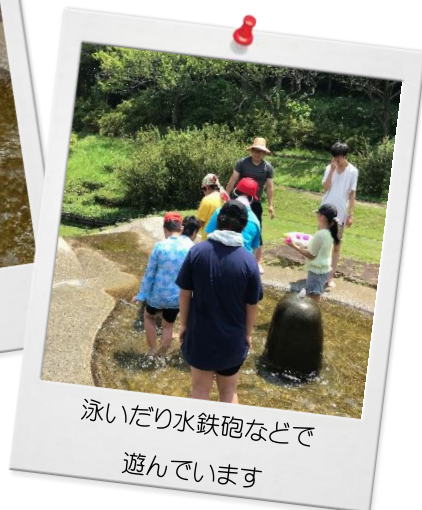
泳いだり水鉄砲などで 遊んでいます