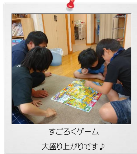
すごろくゲーム 大盛り上がりです♪