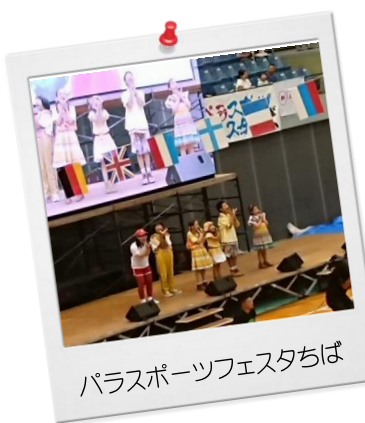
パラスポーツフェスタちば