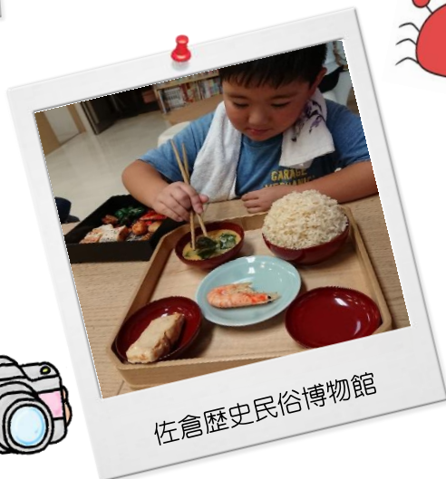
佐倉歴史民俗博物館